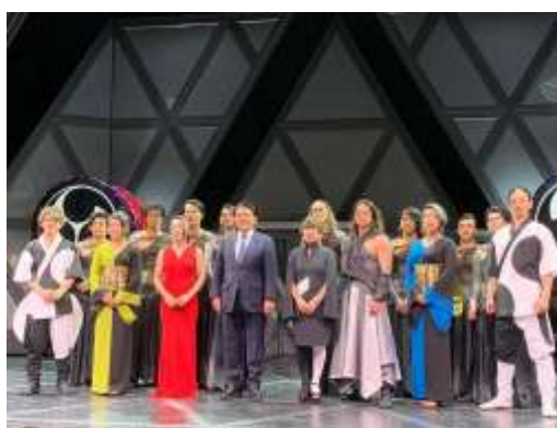
DRUM TAOの「万華響-MANGEKYO」の初日公演に参加し、メディアプレゼンテーションにて挨拶。まさにクールジャパンです。(4/10)