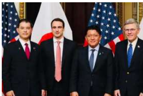
柴山文部科学大臣と共同議長で「日米科学技術協力合同高級委員会」を開催。AI、ムーンショット研究開発などで合意を得ました。(5/3)