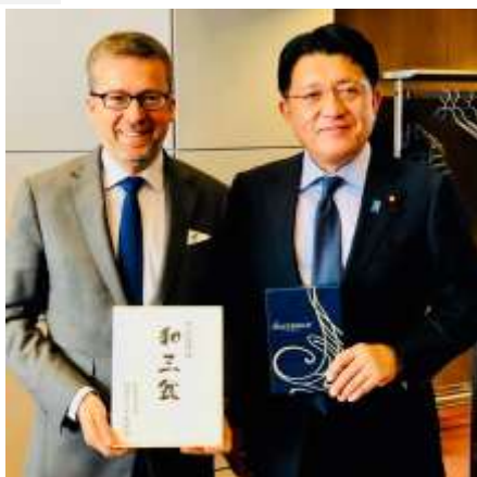
EUのモエダス研究・科学・イノベーション担当欧州委員と会談。連携強化を進めていくことになりました。(5/3)