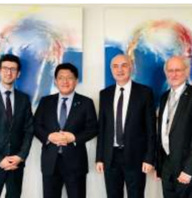
エレクトロニクス分野における世界的研究拠点IMECを訪問。(5/4)