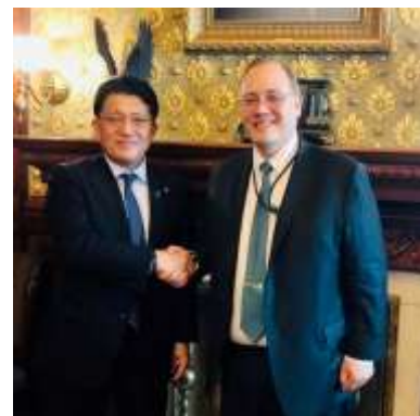
ペース国家宇宙会議事務局長と会談。日米の宇宙産業振興策、宇宙安全保障分野での日米連携強化など幅広く意見交換(5/3)