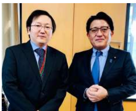
ハリウッド俳優、マシ・オカ氏によるピッチ。「日本のコンテンツ(映像)関連ビジネスが世界で稼ぐための提案」について。(4/3)