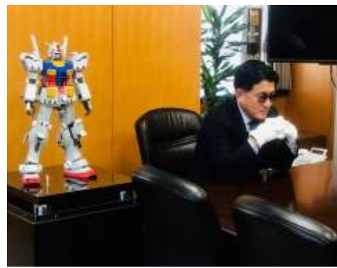
クールジャパン政策担当大臣として、IOEA(国際オタクイベント協会)が世界各地で開催するオタクイベント用のビデオメッセージを撮影。(4/16)