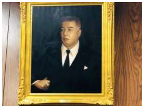
参議院の内閣委員会。この委員会室には父の肖像画があり、いつも見られているような気がします。(4/14)