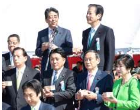
安倍総理主催の桜を見る会。平成最後の会は素晴らしい天候に恵まれました。(4/14)