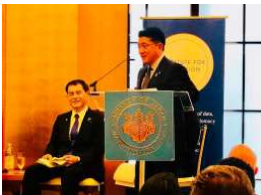
ワシントンDCの駐米日本大使公邸にて「AI and Governments」を開催。日本の「人間中心のAI社会原則」の内容や、現在検討中のAI国家戦略についてスピーチしました。(5/2)