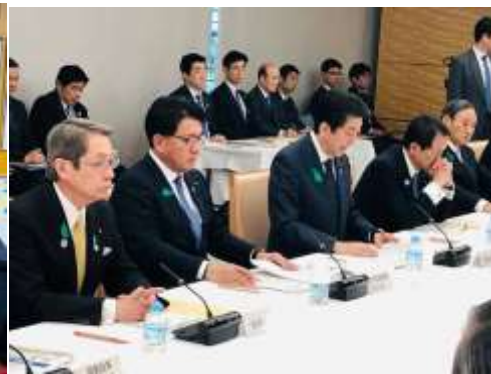
総合科学技術・イノベーション会議を開催。「AI戦略」の要は「教育改革」です。(4/18)