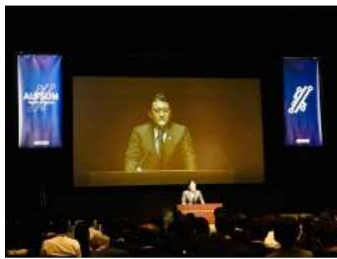
AI/SUM (アイサム: Applied AI Summit) シンポジウムにて「我が国のAI原則/AI戦略について」と題し基調講演を行いました。(4/23)