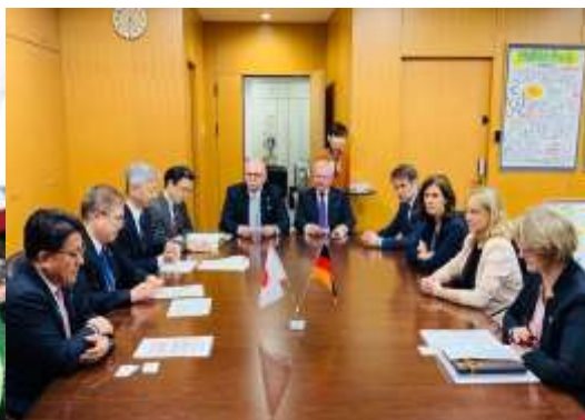
ドイツのカルリチェック連邦教育研究大臣らの表敬訪問を受けました。ドイツは、科学技術協力の重要なパートナーです。(4/16)