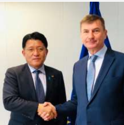
EUのアンシブ副委員長（エストニア元首相）と会談。AI社会原則、日EUデジタル協力など、率直な意見交換が出来ました。(5/3)